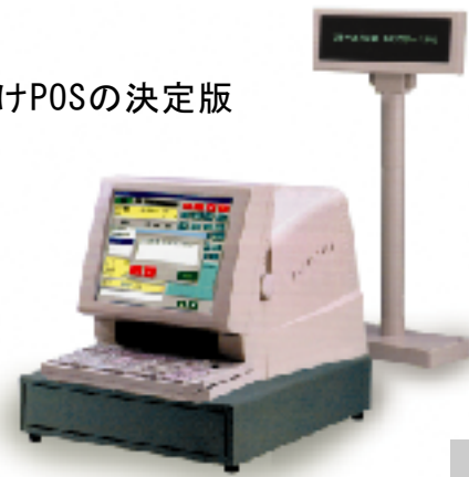
ハンズキャナー付属