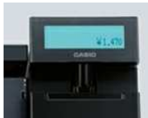
カスタマーディスプレイ